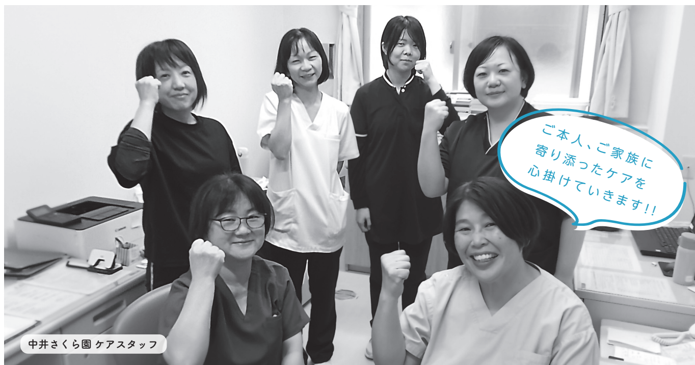
中井さくら園 ケアスタッフ

※医療的ケア児…人工呼吸器や胃ろう等を使用し、たんの吸引や経管栄養などの医療的ケアが日常的に必要な児童のこと