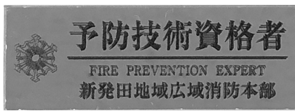
この標示が目印です