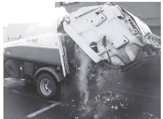
燃えないごみの運搬中に収集車で火災が発生したときの様子(原因の特定はできていません)

ガスが残ったままのスプレー缶が原因で運搬中や処理中に爆発事故や火災が起きています！