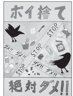
平成29年度ポスター賞

問い合わせ 新発田地域広域事務組合 事務局 業務課 ☎ : 0254-26-1501 ✉ : gyomu@shibata-kouiki.jp