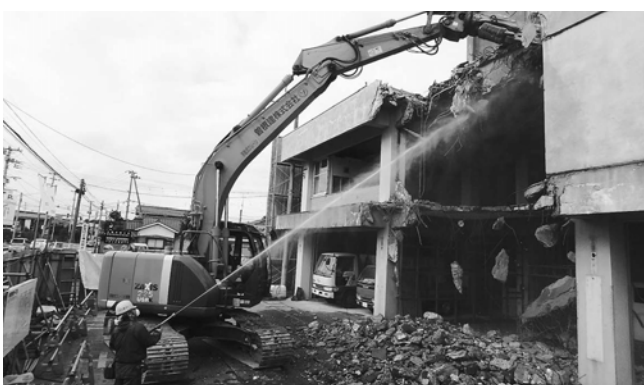
中央出張所の解体工事