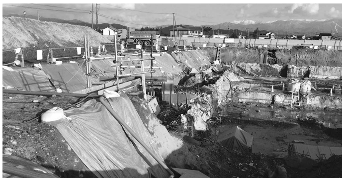
旧新発田衛生センターの解体工事