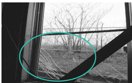
破損した窓ガラス

幸いにも人的被害や火災には至りませんでしたが、破碎設備と操作室等のガラス5枚、出入口のドアフレーム変形等の被害がありました。