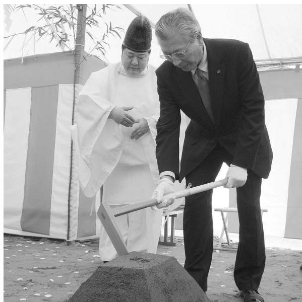
新施設の安全祈願祭