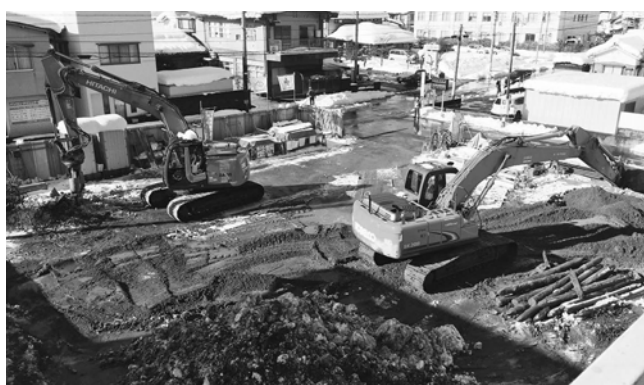
建物の解体・撤去後