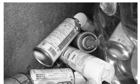
回収された穴の開いていないスプレー缶

次号は平成29年4月発行の予定です。 市町によって配布日が異なります。「新発田地域広域事務組合 広報」に関する皆さんからのご意見、ご感想をお待ちしています。