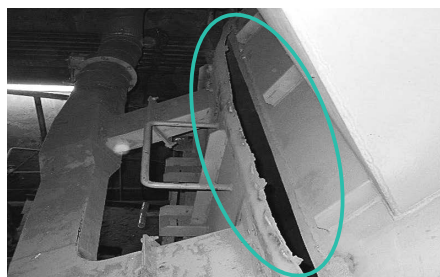
変形した破碎機カバー