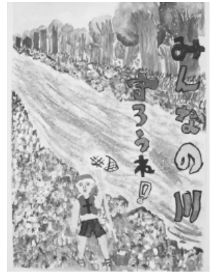
平成27年度ポスター賞